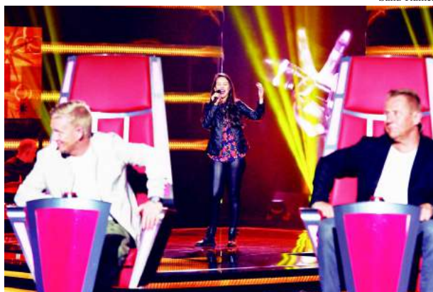
Dois momentos de sua participação no programa: na primeira apresentação e no "duelo", que venceu

de me mudar pra Finlândia já havia me decidido que queria atuar na indústria musical. Claro que ficaria super feliz de me apresentar em Viçosa para meus conterrâneos.